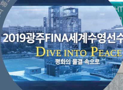
2019광주FINA세계수영선수권대회 홍보 영상