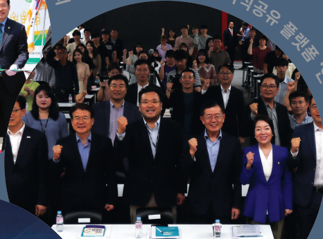
지식공유 플랫폼 '인사이트 포럼'