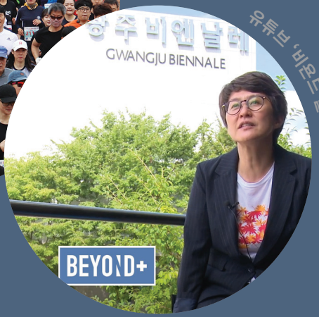
유튜브 '비욘드 플러스' 채널