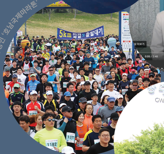
국제 공인 '호남국제마라톤'